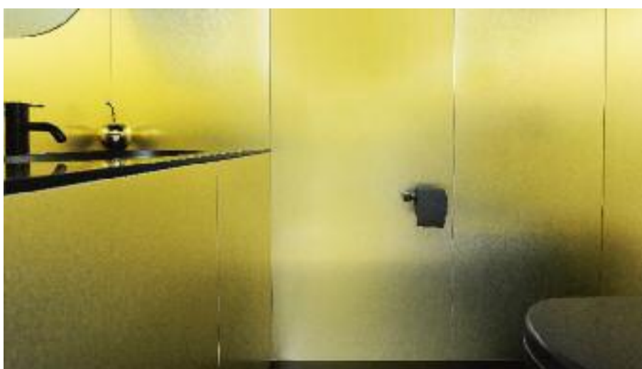
De wanden van de wc zijn bekleed met decoratieve platen in goudkleur van Abet Laminati. Al de rest is zwart, inclusief het toilet papier.

Dat gebeurde niet alleen met kleuren, maar ook met materialen. In de badkamer van de ouders, die verstopt zit achter een van de kastdeuren van de dressing, is net als in de keuken marmer gebruikt. Geheel in de lijn van de verwachtingen gebeurde dat op een niet zo'n gebruikelijke manier. Zo bevindt de douche zich net als het bad een paar treden hoger dan de rest van de ruimte. Daar zat zoals bij alles in dit project zowel een praktische — handig om de nieuwe leidingen te leggen — en een esthetische reden — het blad van het wasmeubel, de badrand en douchevloer liggen op hetzelfde niveau — achter.