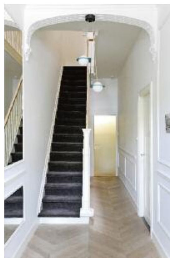
In de gang valt onmiddellijk de gouden deur naar het toilet op.