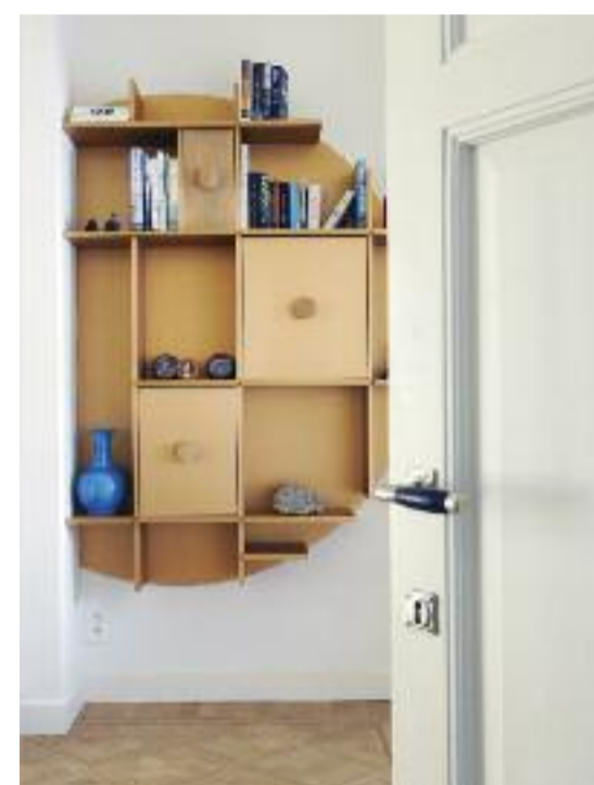
Speelsheid in kleur én in vorm. Dit wandmeubel blinkt uit in originaliteit.

Het kookgedeelte zit verstopt in een nis met een spatwand van marmer. De groene PU-vloer loopt door op de muur.